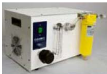
Compresor Oil Less para los modelos de mayor tamaño.

El Kit estándar incluye : bolso de transporte con correas para el hombro, colchón, set de soportes para la cámara, 3 mts de manguera de conexión grado medico con acoples rápidos, manómetro, compresor de 1/4 HP Oil Less de doble cabezal con filtros de entrada, filtro de alta eficiencia de 0,01 micrón, etc.