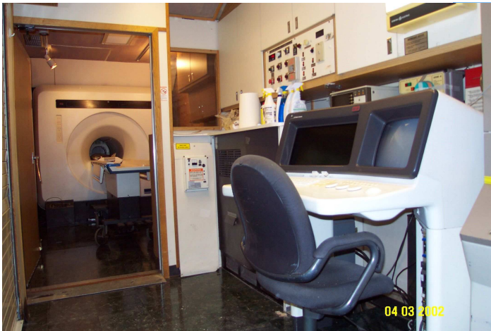
Móvil de Resonancia Magnética